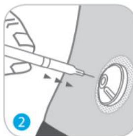
נקבו את המחיצה על ידי המחט של המזרק.