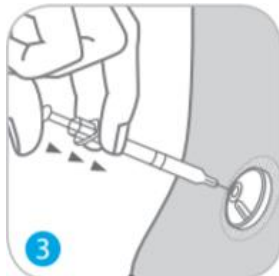
הזריקו באיטיות את התרופה.