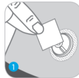
נקו את המחיצה לפני כל שימוש.