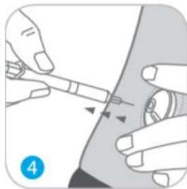
הוציאו את המזרק.