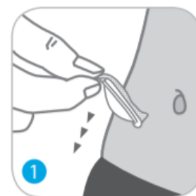
אחזו בשולי משטח המדבקה והסירו